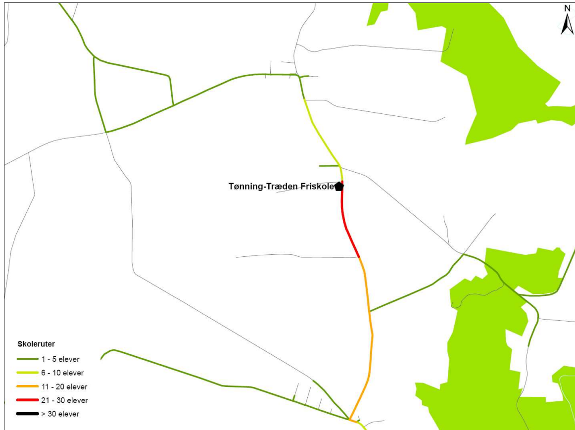
Figur 2. Udpegning af ruter til og fra skole for de gående og cyklende omkring Tønning-Træden Friskole.

På efterfølgende figur ses de ruter til og fra skole som de gående og cyklende elever har udpeget omkring Tønning-Træden Friskole.