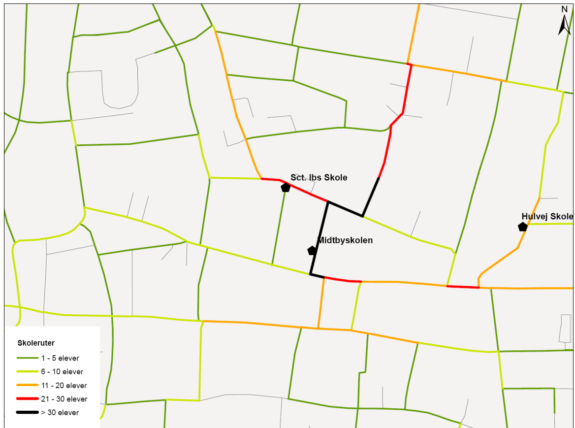
Figur 2. Udpegning af ruter til og fra skole for de gående og cyklende omkring Sct. Ibs Skole.

Kortet viser endvidere de ruter, som nogle elever på de naboliggende skoler anvender.