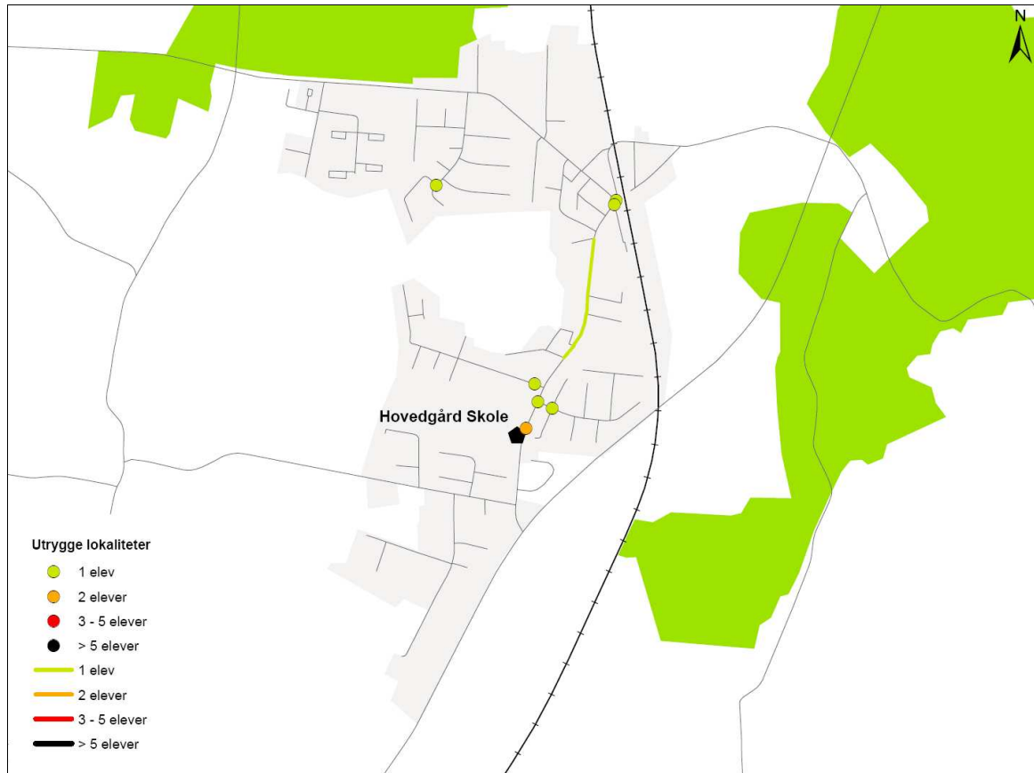
Figur 3. Samtlige elevers angivelse af farlige og utrygge steder på veje og stier omkring Hovedgård Skole.

Udpegningen af utrygge lokaliteter omkring Hovedgård Skole viser, at der er få lokaliteter, der opfattes som utrygge.