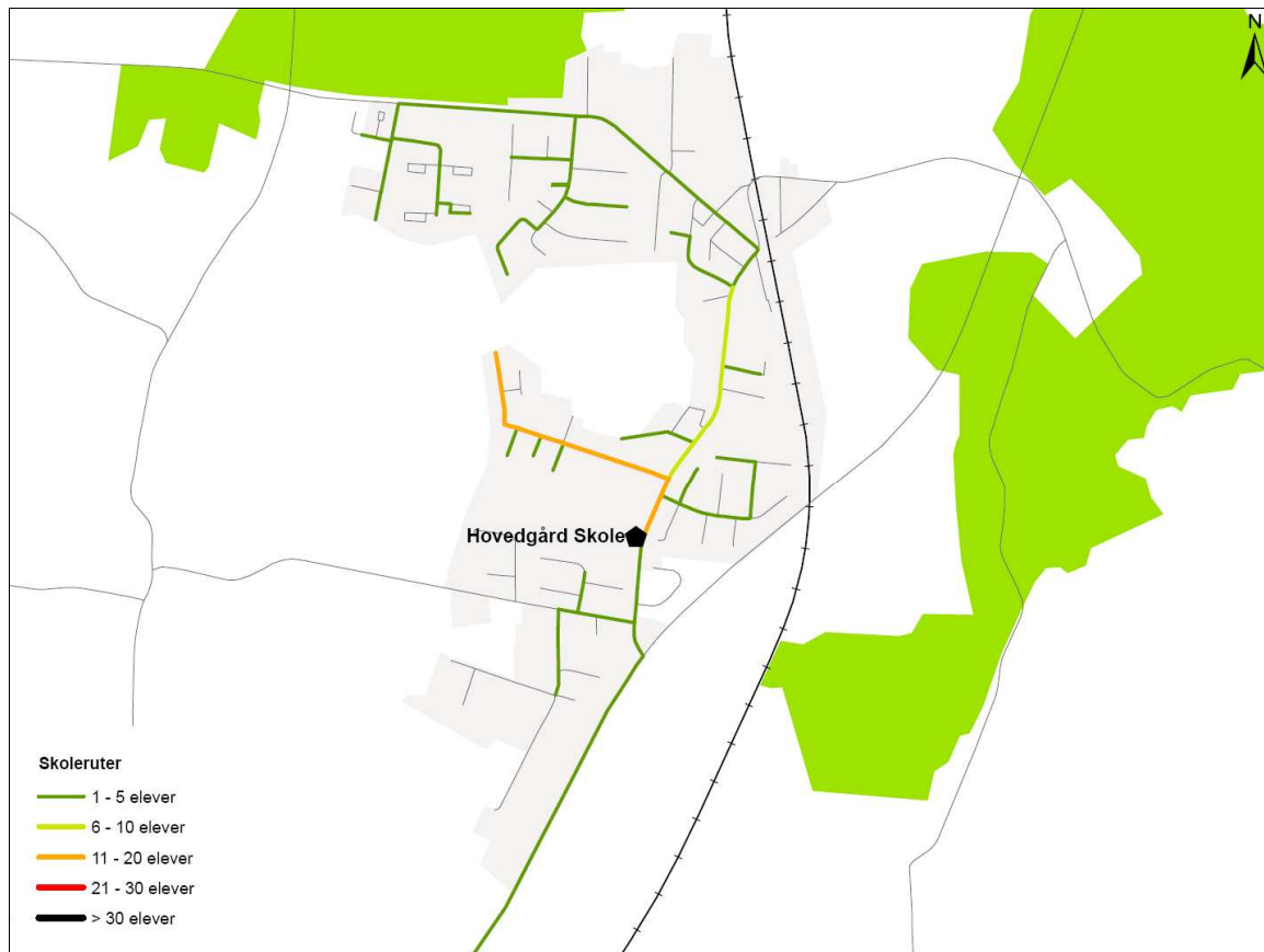
Figur 2. Udpegning af ruter til og fra skole for de gående og cyklende omkring Hovedgård Skole.

På efterfølgende figur ses de ruter til og fra skole som de gående og cyklende elever har udpeget omkring Hovedgård Skole.