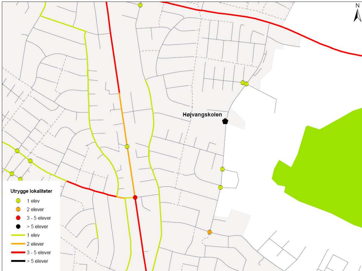
Figur 3. Samtlige elevers angivelse af farlige og utrygge steder på veje og stier omkring Højvangskolen.

Kortet viser endvidere utrygge lokaliteter, som nogle elever på de naboliggende skoler har udpeget.