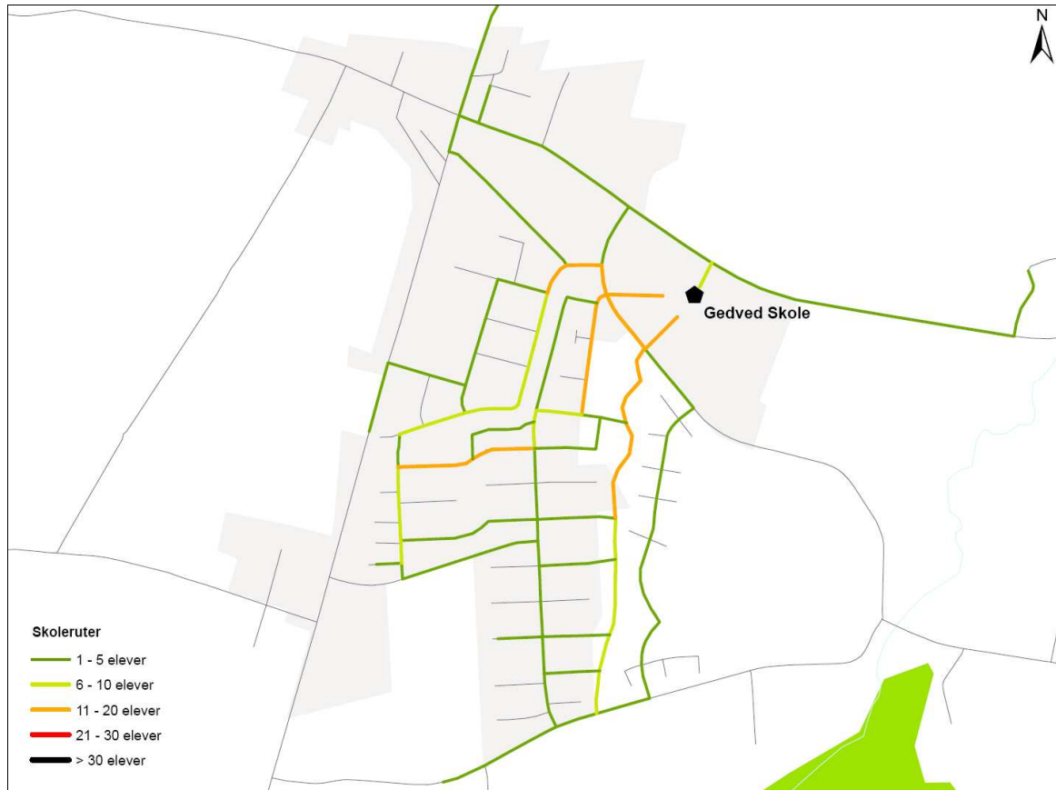
Figur 2. Udpegning af ruter til og fra skole for de gående og cyklende omkring Gedved Skole.

På efterfølgende figur ses de ruter til og fra skole som de gående og cyklende elever har udpeget omkring Gedved Skole.