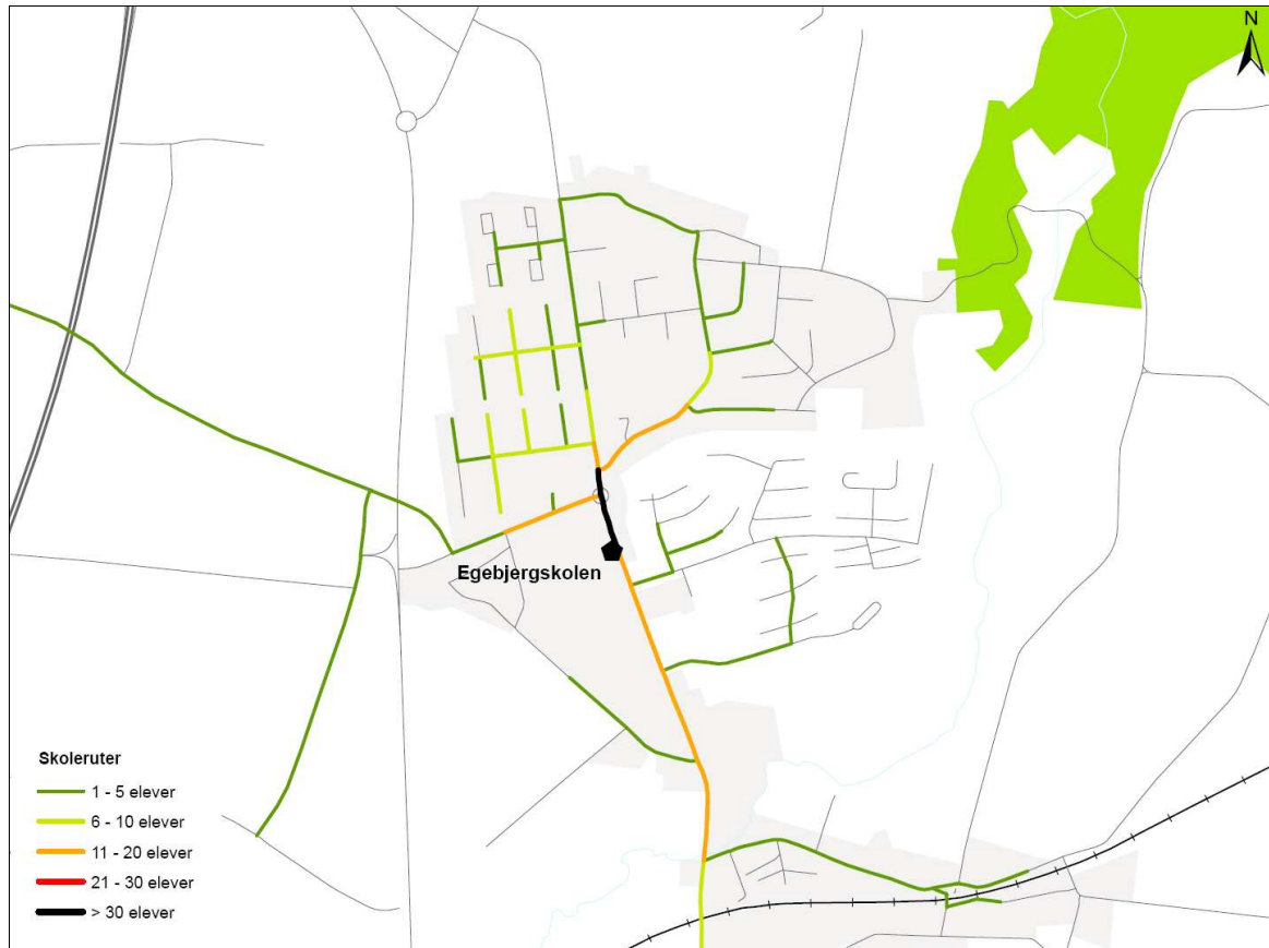
Figur 2. Udpegning af ruter til og fra skole for de gående og cyklende omkring Egebjergskolen.

På efterfølgende figur ses de ruter til og fra skole som de gående og cyklende elever har udpeget omkring Egebjergskolen.