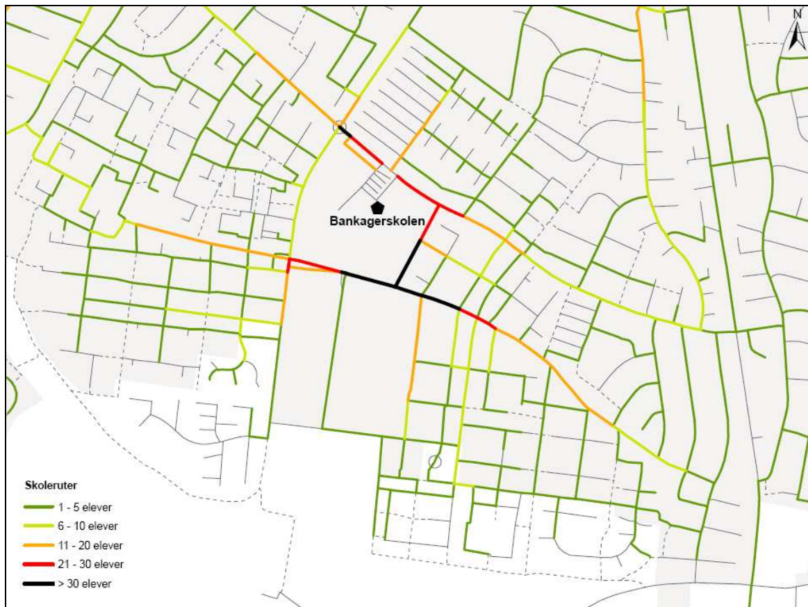
Figur 2. Udpegning af ruter til og fra skole for de gående og cyklende omkring Bankagerskolen.

På efterfølgende figur ses de ruter til og fra skole som de gående og cyklende elever har udpeget omkring Bankagerskolen.