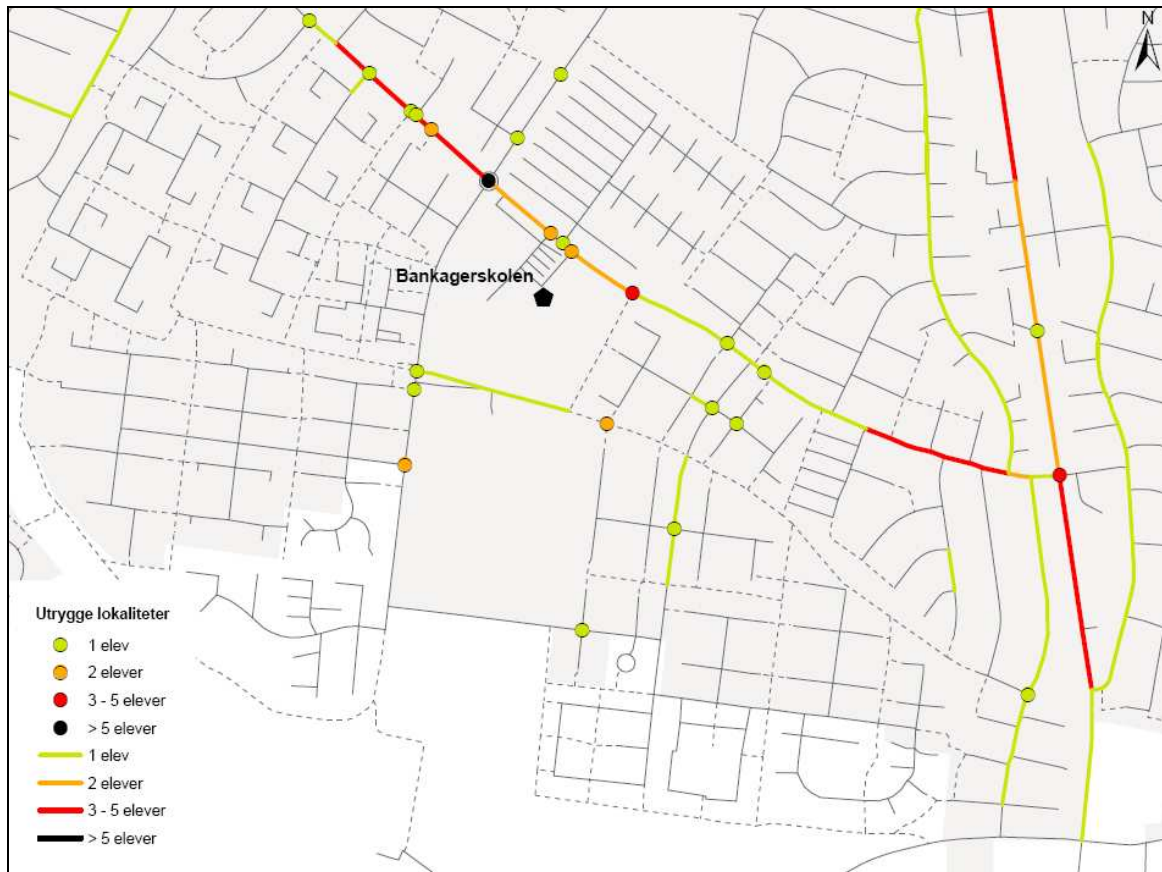
Figur 3. Samtlige elevers angivelse af farlige og utrygge steder på veje og stier omkring Bankagerskolen.

Udpegningen af utrygge lokaliteter omkring Bankagerskolen viser, at der er få lokaliteter, der opfattes som utrygge.