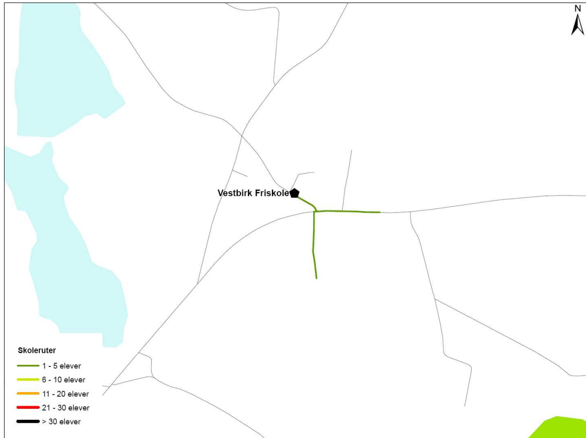
Figur 2. Udpegning af ruter til og fra skole for de gående og cyklende omkring Vestbirk Friskole.

På efterfølgende figur ses de ruter til og fra skole som de gående og cyklende elever har udpeget omkring Vestbirk Friskole.