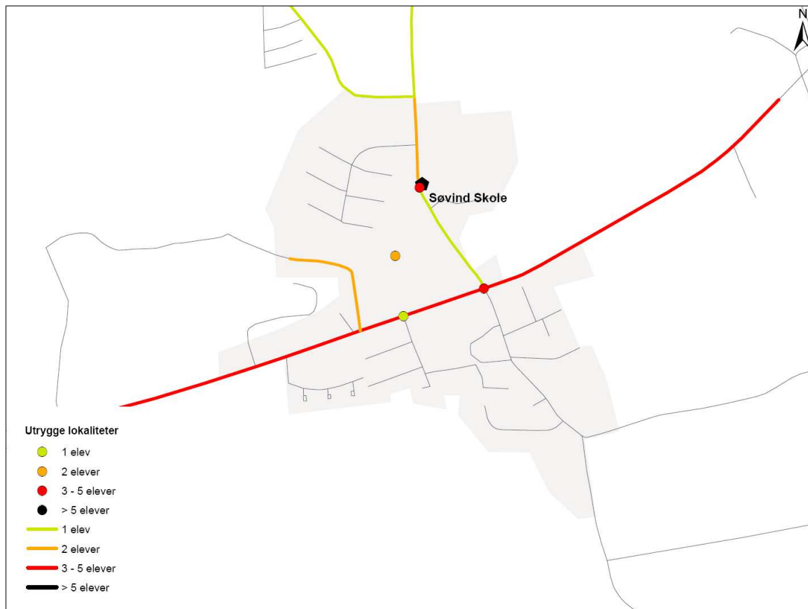
Figur 3. Samtlige elevers angivelse af farlige og utrygge steder på veje og stier omkring Søvind Skole.

Udpegningen af utrygge lokaliteter omkring Søvind Skole viser, at der er flere lokaliteter, der opfattes som utrygge, men kun af få elever.