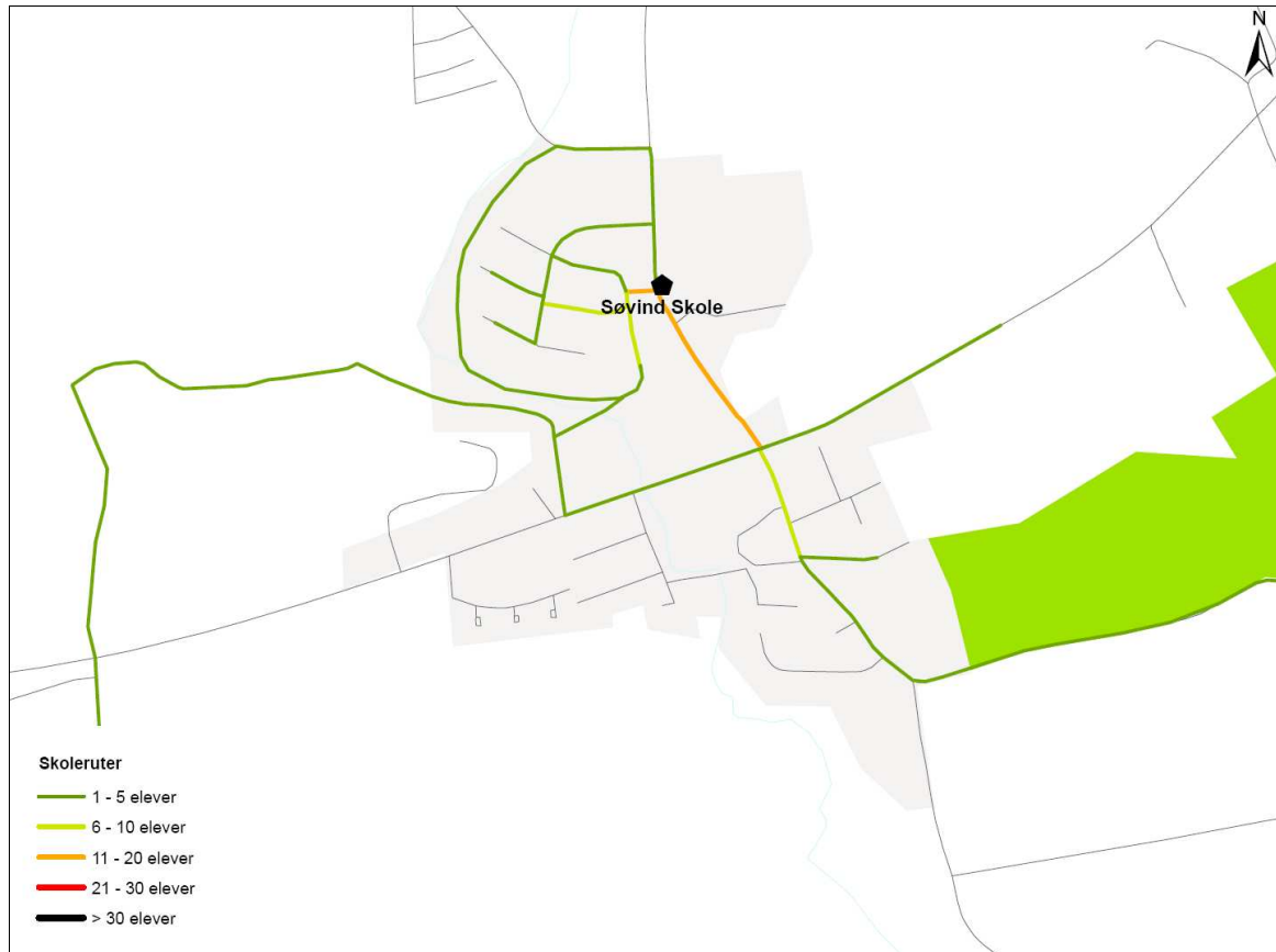
Figur 2. Udpeging af ruter til og fra skole for de gående og cyklende omkring Søvind Skole.

På efterfølgende figur ses de ruter til og fra skole som de gående og cyklende elever har udpeget omkring Søvind Skole.